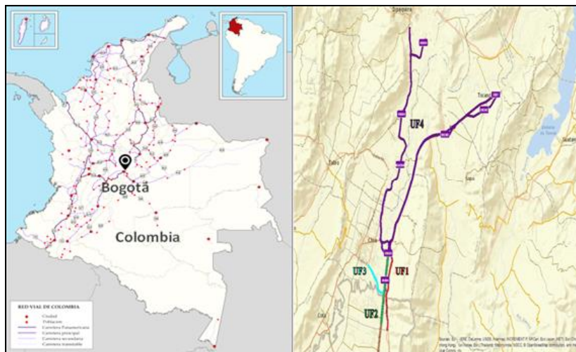
Grafico 1 Localización General Concesión Accesos Norte de Bogotá